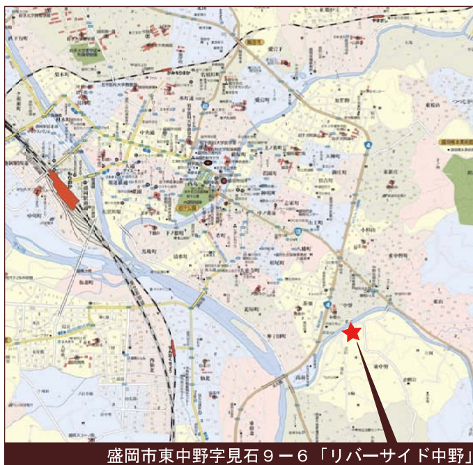
盛岡市東中野字見石9-6「リバーサイド中野」