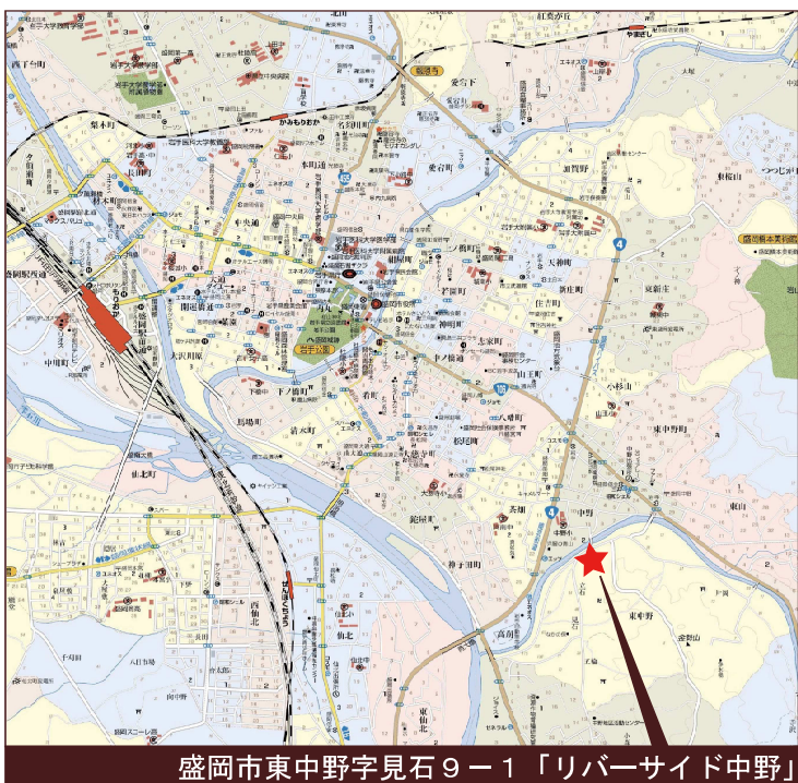
盛岡市東中野字見石9-1「リバーサイド中野」